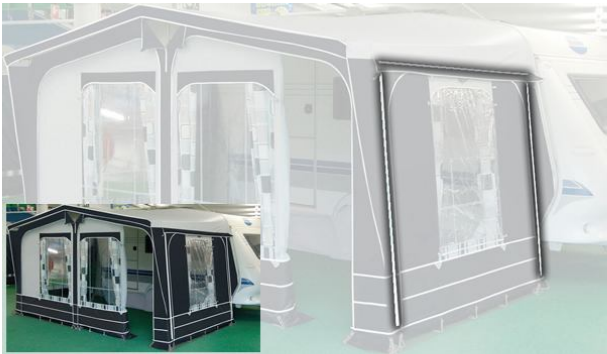
2.4 De pezen waar de erker aan bevestigd dient te worden