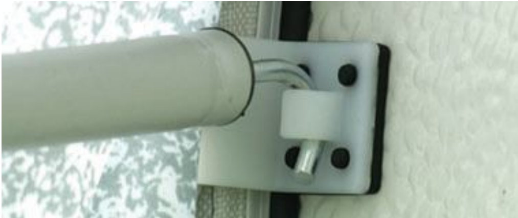
1.4 de shs clip

Mocht u geen gebruik willen maken van SHS clips dan dient u uw caravan te voorzien van de bijgeleverde tentogen. Voordat u deze met de meegeleverde schroeven monteert is het noodzakelijk onder de tentogen een afdichtingsmiddel (bijvoorbeeld kit) aan te brengen. Let erop dat de tentogen iets van de tentrail af geplaatst moeten worden zodat er genoeg ruimte overblijft om de haakstok in het oog te bevestigen. De tentogen voor de dakliggers aan de zijkant moeten op een hoogte van ca 210 cm van de grond gemeten worden geplaatst. Het tentoog voor de centrale dakligger dient uiteraard precies in het midden geplaatst te worden. Bij grotere maten voortenten worden 2 extra dakliggers en tentogen meegeleverd.